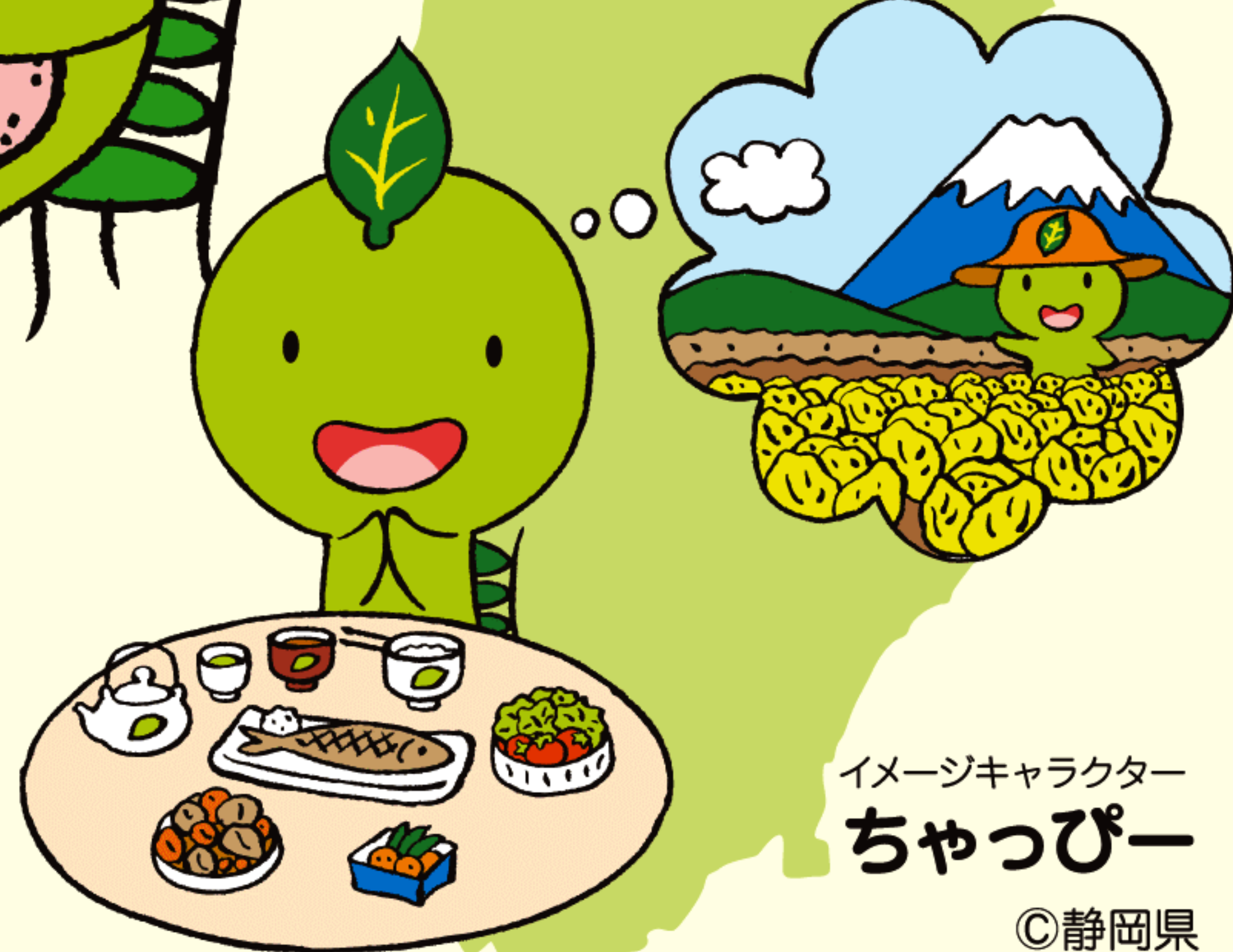
イメージキャラクター ちゅっぴー